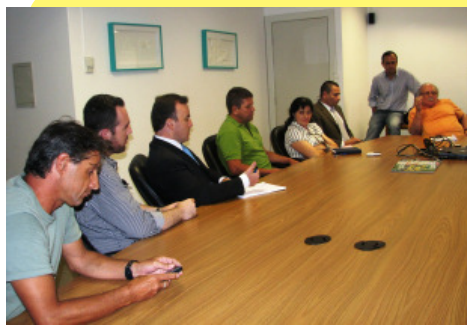
Reunião realizada no dia 18/12/2009

Foi nesse sentido que exigimos uma audiência com LHS para ouvir do próprio Governador o que ele pensa em